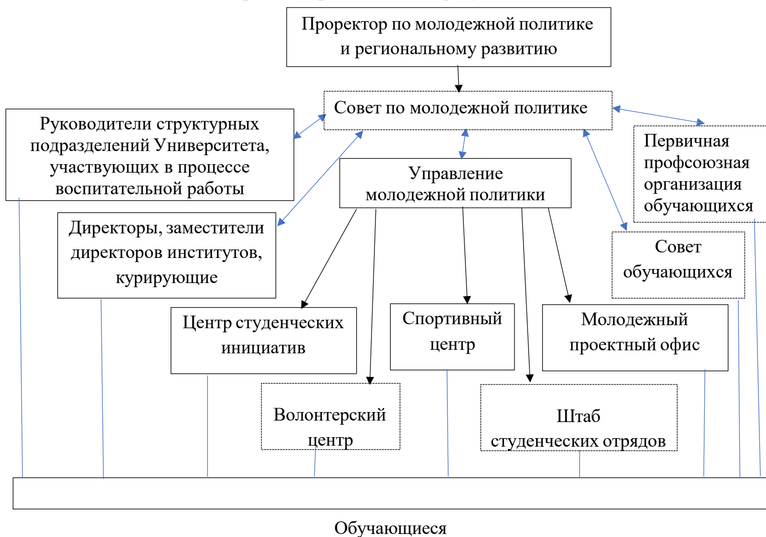
Рисунок 1. Структура управления воспитательной деятельностью

Структура управления воспитательной деятельностью и молодежной политикой Университета представлена на рисунке 1.