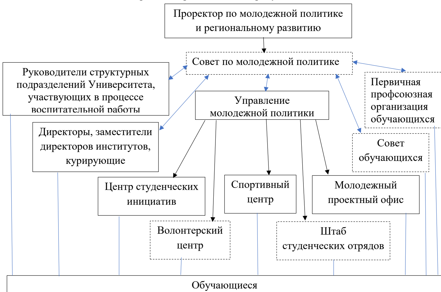
Рисунок 1. Структура управления воспитательной деятельностью

Структура управления воспитательной деятельностью и молодежной политикой Университета представлена на рисунке 1.